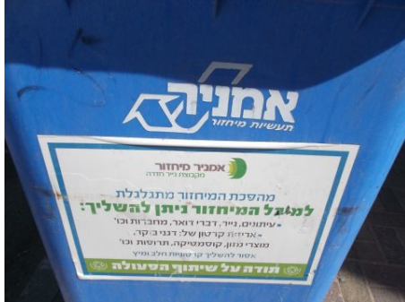
עתרה נגד המכרז

טוענת שמכרז ענק לפינוי פסולת נייר ומדיה מגנטית כמעט בכל השירות הציבורי, כולל תנאי סף שרק חברת ק.מ.מ. יכולה לעמוד בו