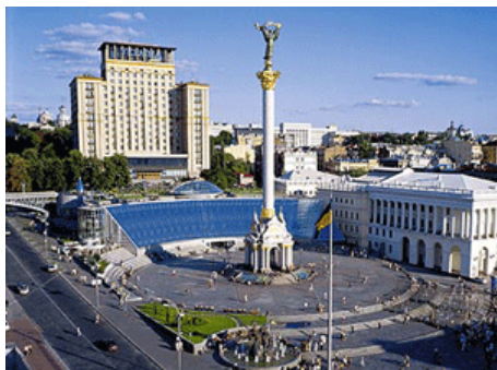
1,400 דונם בקייב

ביהמ"ש דחה ערעורים הודדים של שתי החברות על החלטת הנאמן לתביעות החוב של אנגל משאבים, בעקבות משיכת כספים מחברה קפריסאית שהקימו השתיים לרכישת קרקע בקייב