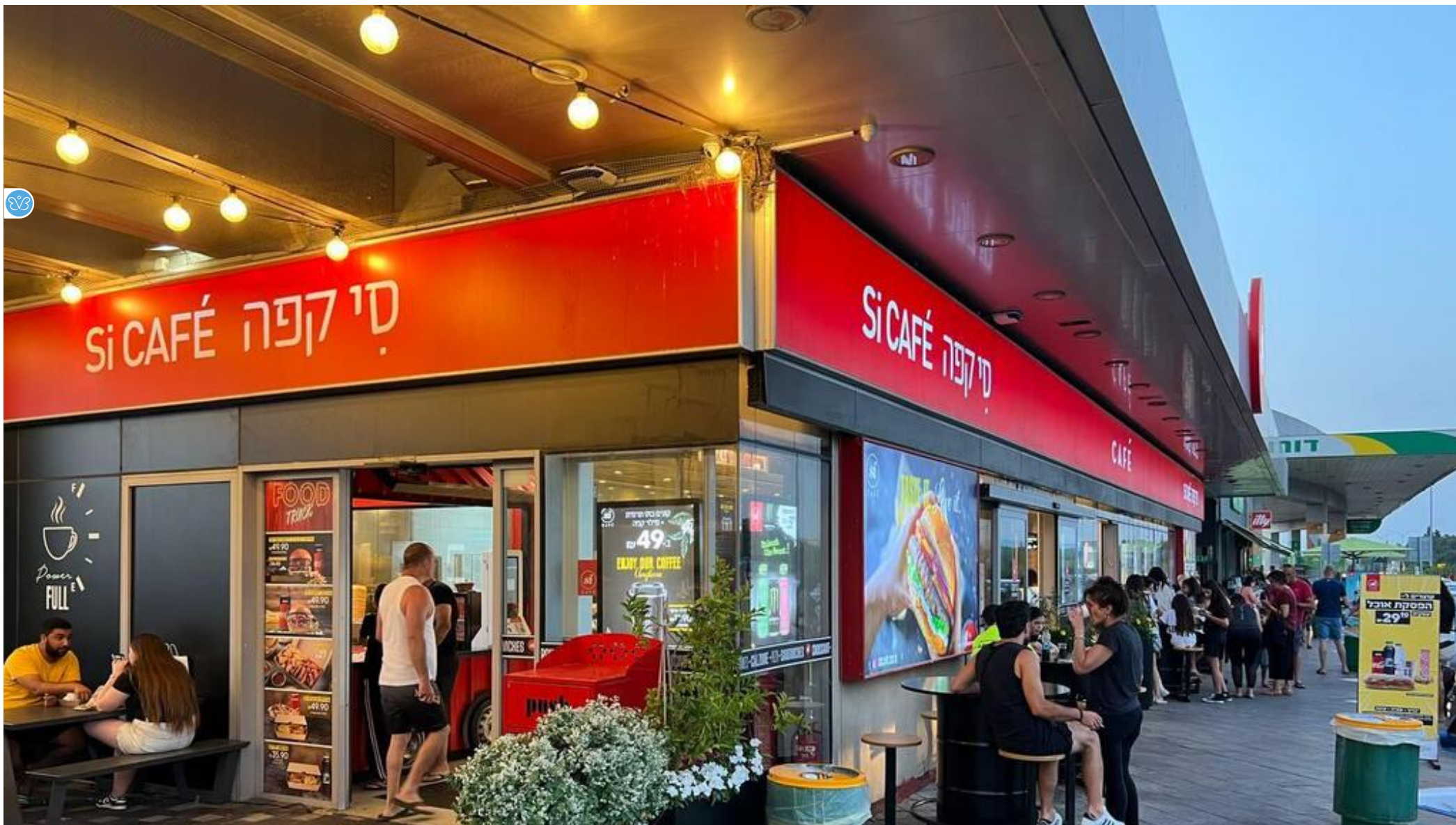
סי קפה בתחנת דלק בכביש 6

מדובר בתביעה שהגישו דרך ארגון היוויז וחברת אלון דלק לפינוי מושכר שעניינה דרישת התובעות להורות על סיומם של הסכמי השכירות אשר נחתמו בין הצדדים, באופן בו הנתבעות תחייבנה לפנות את המושכרים.